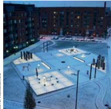
Puisto lumen alla