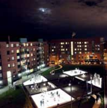
Puiston avajaiset 22.10.2012

Kahdessa puupintaisessa huoneessa on tikkumaiset hevosveis-tokset; iso ja pieni pronssihevosveistos. Istumapaikkoina niissä toimivat pitkät mustat teräspalkit.